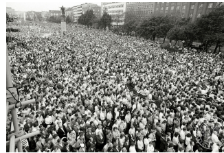
Tłumy wiernych przy Skwerze Kościuszki obserwują spotkanie Jana Pawła II z ludźmi morza. W tle nieistniejący już pomnik-obelisk ku czci Żołnierzy Radzieckich tzw. „Natasza”. 11 VI 1987 r. Sygnatura: IPNBU-7-7-3-217