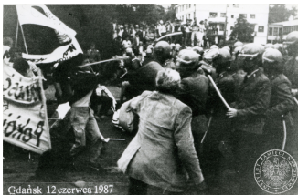
Starcie demonstrantów z oddziałem ZOMO w Gdańsku po mszy św. na Zaspie, w dn. 12 VI 1987 r.