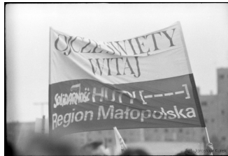
Transparent Solidarności Huty Regionu Małopolska „Ojciec Święty Witaj” w czasie mszy świętej na Zaspie w Gdańsku. 12 VI 1987 r. IPN BU 3620/1