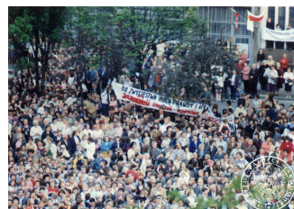
Tłum wiernych na Skwerze Kościuszki w Gdyni w czasie