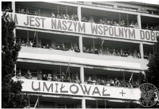
Wierni na balkonach bloku przy Skwerze Kościuszki obserwują spotkanie Jana Pawła II z ludźmi morza. Na balkonach napis „[Ojczy]na jest naszym wspólnym dobr[em]” i „[Do końca ich] Umiłował” 11 VI 1987 r.