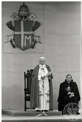
Jan Paweł II przemawia na podwyższeniu w towarzystwie prymasa Polski Józefa Glempa, w czasie spotkania z ludźmi morza przy Skwerze Kościuszki, 11 VI 1987 r., Sygnatura: IPNBU-7-7-3-209