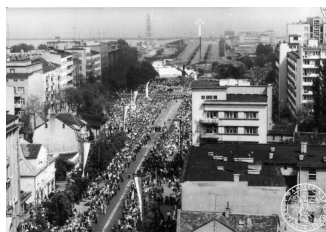
Widok na ul. 10 lutego oraz na Skwer Kościuszki w Gdyni