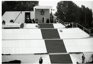
Jan Paweł II przemawia na podwyższeniu w towarzystwie innych duchownych w czasie spotkania z ludźmi morza przy Skwerze Kościuszki. 11 VI 1987 r., Sygnatura: IPNBU-7-7-3-127