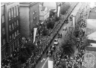
Kolumna samochodów z orszaku papieskiego z papamobile Jana