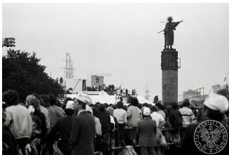
Tłumy wiernych przy Skwerze Kościuszki obserwują spotkanie Jana Pawła II z ludźmi morza. 11 VI 1987 r. Sygnatura: IPNBU-7-7-3-161