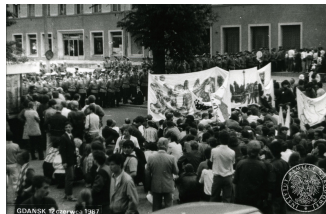
Zetknięcie się czoła pochodu demonstrantów z Solidarnościowymi transparentami z kordonem funkcjonariuszy MO przy ulicy ks. L. Miszewskiego w Gdańsku -Wrzeszczu. 12 VI 1987 r.